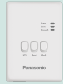
CZ-TAW1. Aquarea Smart Cloud for remote control and maintenance through wireless or wired LAN.