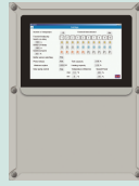
PAW-A2W-CMH Cascade Controller. Modbus IP for BMS communication.